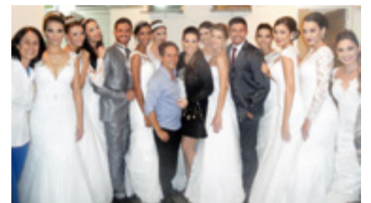
Pausa na passarela do Expo Maisvip

Os times femininos de Handebol da Escola Municipal Nelcina Rosa de Jesus, e de Futsal do Colégio Tiradentes, se classificaram na etapa microrregional, e vão agora representar Ipatinga nos duelos da Fase Regional dos Jogos Escolares de Minas (JEMG 2015). As competições serão disputadas em Itabira, entre os dias 22 a 27 de junho.